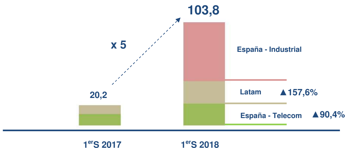
Detalle Cartera Proyectos Continuados (Millones euros)

La cifra de cartera de proyectos citada se comenzará a ejecutar en los próximos meses lo que consolida el cumplimiento de los objetivos marcados para el ejercicio 2018 en el Plan Estratégico.